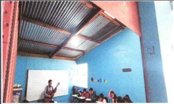
Foto1: SUSTITUCION DE TECHADO DE MADERA POR METAL, ESTRUCTURA Y LAMINAS, AULA DE 5to Y 6to.