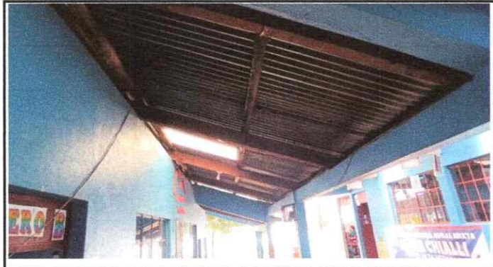
Foto 1. SUSTITUCION DE TECHADO DE MADERA POR METAL, POR LAMINAS TROQUELADAS CORREDDOR Y PATIO DE LA ESCUELA