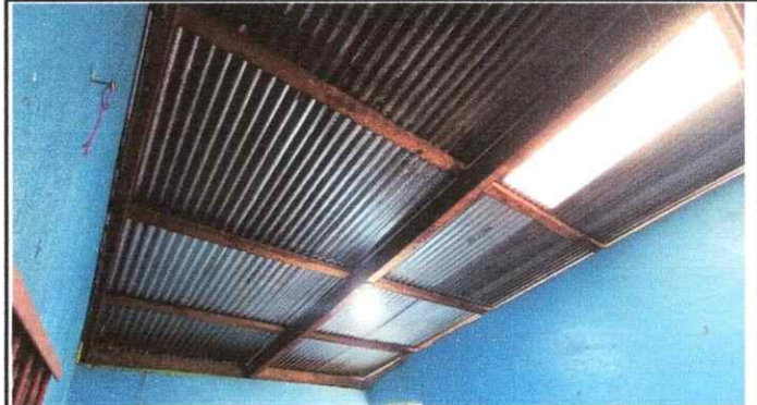
Foto 2: SUSTITUCION DE TECHO DE MADERA POR TECHO DE METAL LAMINAS TROQUELADAS