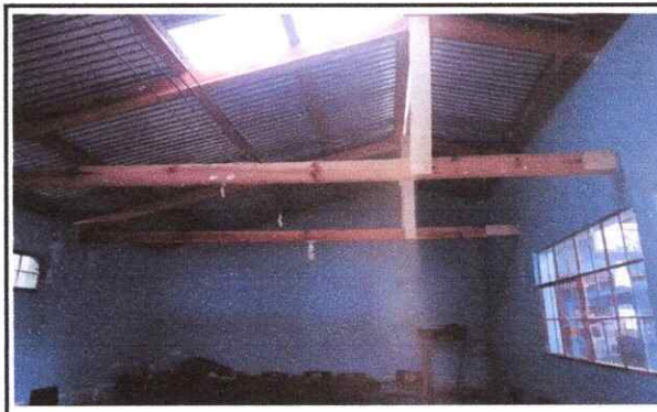
Foto 1: SUSTITUCION DE TECHO DE MADERA POR METAL, TODA LA ESTRUCTURA 5TO