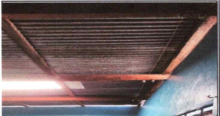
Foto 6: SUSTITUCION DE TECHO DE MADERA POR METAL, TODA LA ESTRUCTURA 4to y 5to.

Observación: Si es necesario se pueden agregar hojas adicionales y actualizar el número de hojas.